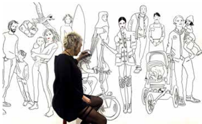
L'artiste en train de réaliser une partie de sa fresque qui peut évoquer la Côte d'Azur.

criminations, elle a composé deux grands panneaux de sept mètres de long autour de la mise à l'écart, l'exode, mais aussi le bien-être et la paix, dénonçant ainsi les clivages existants entre les uns et les autres. Une réflexion sur le genre humain menée au feutre noir, aux silhouettes très graphiques, d'un trait net et direct.